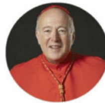
Cardinal Robert McElroy Bishop of San Diego