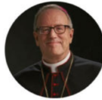
Bishop Robert Barron Bishop of Winona-Rochester

A virtual event streaming live - May 14, 12 p.m. usccb.org/civilize-it-virtual-event