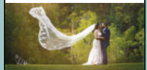
Photo & video Services